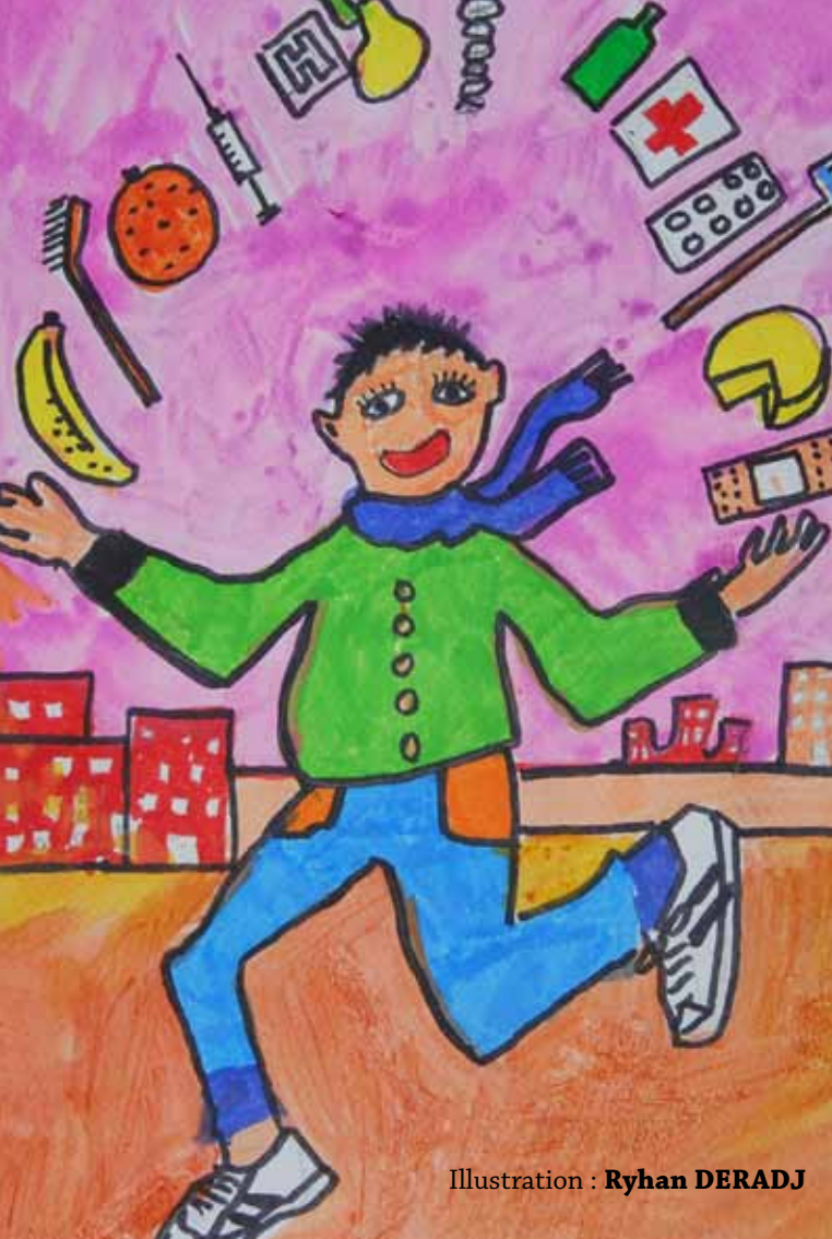
Illustration : Ryhan DERADJ

Je viens d’emménager à Grigny, quelles démarches dois-je effectuer pour ma santé ?