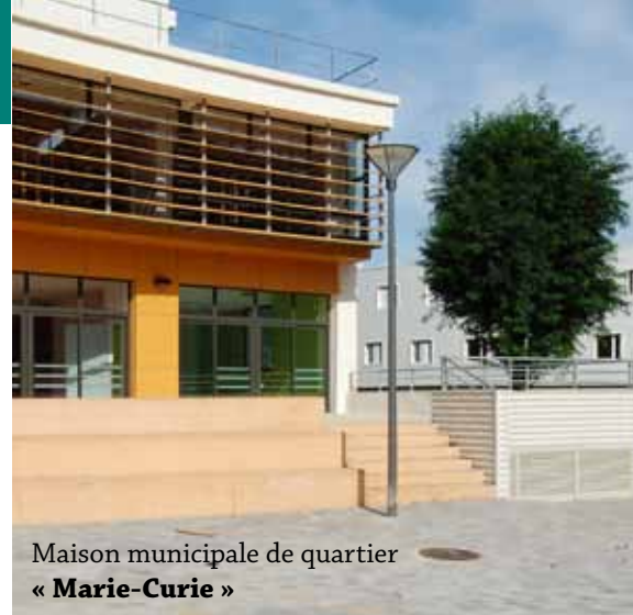
Maison municipale de quartier « Marie-Curie »

Maison des associations 1, rue du Minotaure 91350 Grigny Tél. 01 69 45 30 10