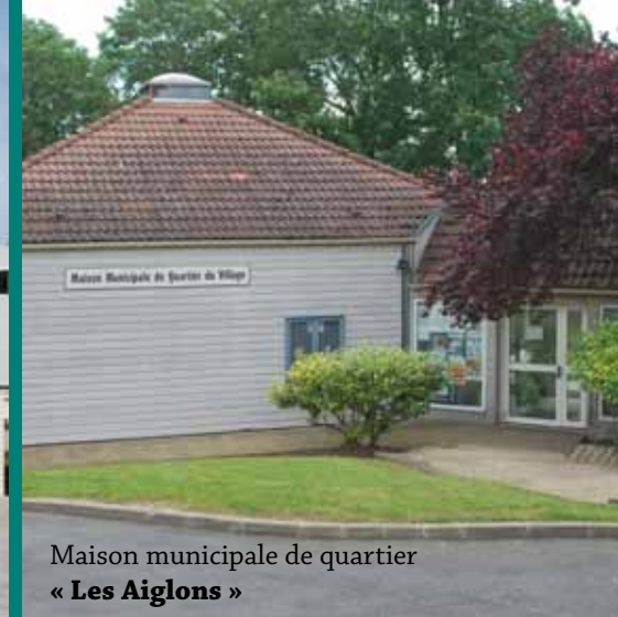
Maison municipale de quartier « Les Aiglons »