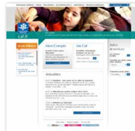
Site internet de la CAF : www.caf.fr

9 Rue Camille Flammarion 91260 Juvisy sur Orge Tél : 01 80 79 10 15