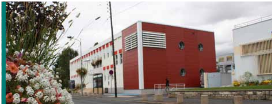
Mairie de Grigny