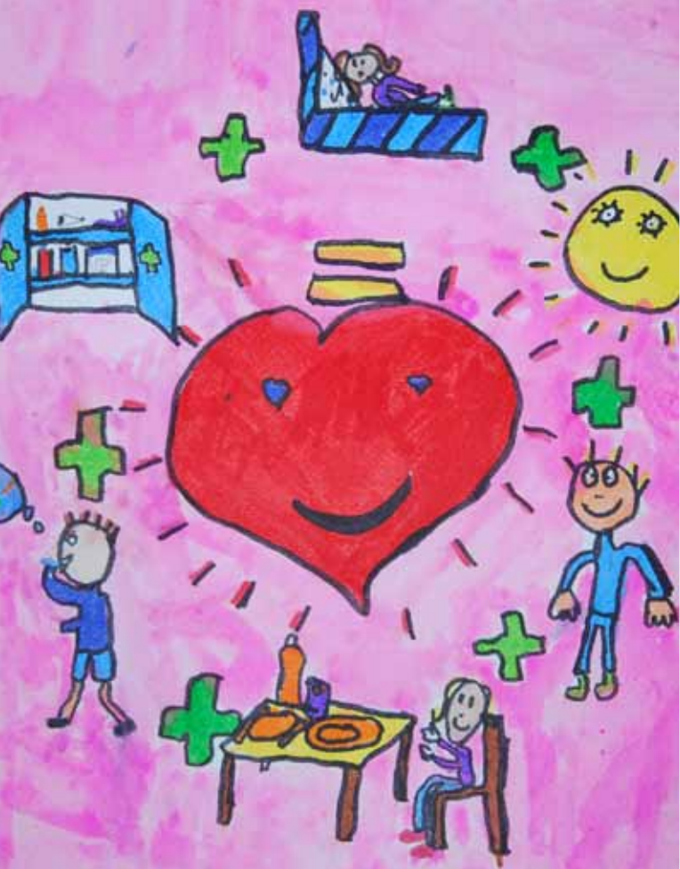
Illustration : Nancy POTICO GEOFFROY