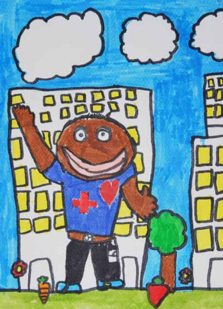
Illustration : Sivadanou BAGAVANE