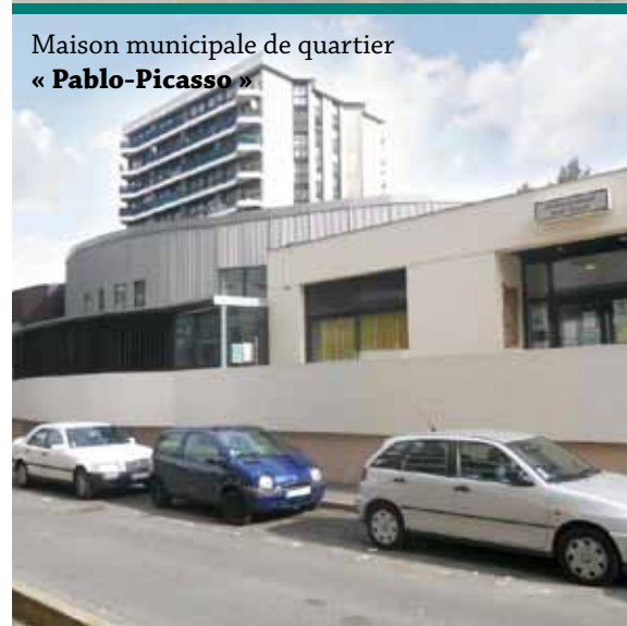
Maison municipale de quartier « Pablo-Picasso »