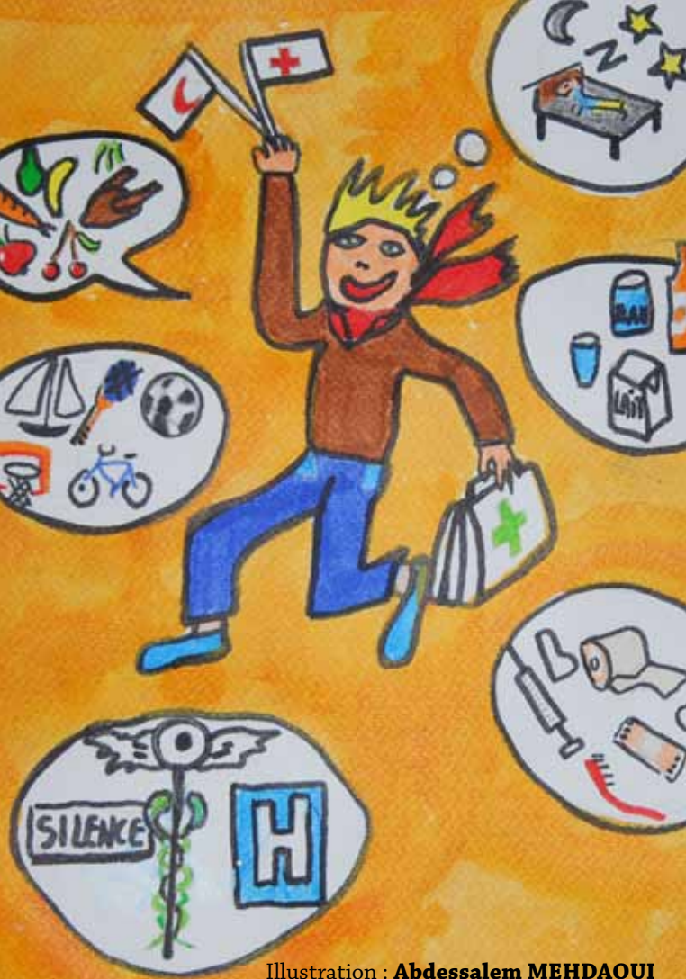
Illustration : Abdessalem MEHDAOUI