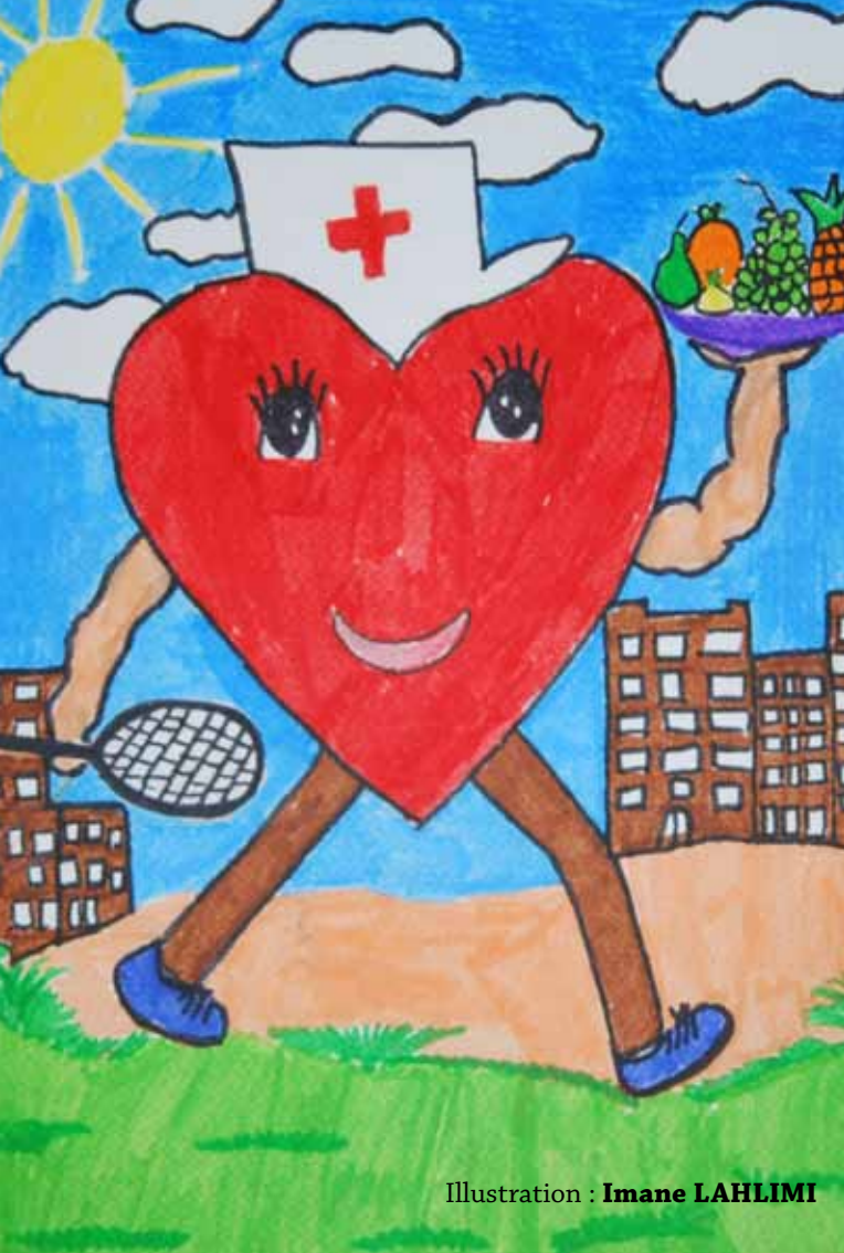
Illustration : Imane LAHLIMI