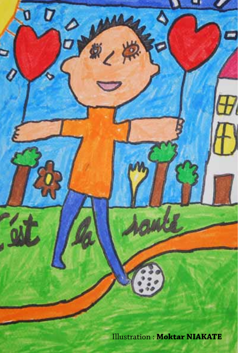
Illustration : Moktar NIAKATE

Mes conditions de vie se dégradent et ma santé aussi. Que faire ?