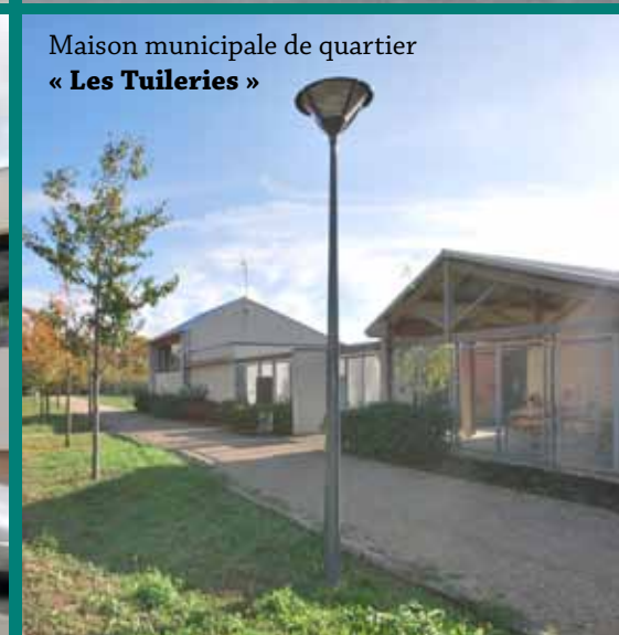
Maison municipale de quartier « Les Tuileries »