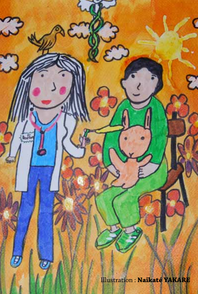
Illustration : Naikaté YAKARE

En cas d'urgence, quels secours solliciter ?