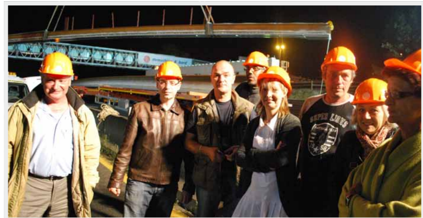
Séquence émotion : Le 10 septembre à minuit, Le Maire, des élus et des agents communaux étaient venus assister à la pose des énormes poutres d'acier qui soutiendront le manteau du pont sur l'A6 tant attendu des grignois.

L e 29 juin dernier, François Lamy, Ministre délégué auprès de la ministre de l'Egalité des territoires et du logement, s'est rendu à Grigny, où il a visité la copropriété de Grigny 2 et la Grande Borne, avant de discuter avec plusieurs acteurs locaux des questions qui intéressent directement les habitants.