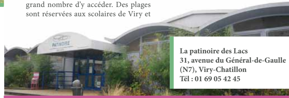
La patinoire des Lacs 31, avenue du Général-de-Gaulle (N7), Viry-Chatillon Tél : 01 69 05 42 45

Grigny. D'autre part, elle développe un travail avec les Instituts médicaux-éducatifs et les hôpitaux pour les enfants et adultes malades ou handicapés. La patinoire accueille également des compétitions de haut niveau, telles que le « Trophée des Lacs », étape du prestigieux Tournoi de France de Danse sur Glace, ou encore une compétition internationale de curling. Véritable lieu de convivialité pour toutes les générations, elle dispose d'une cafétéria avec la possibilité d'une restauration rapide.