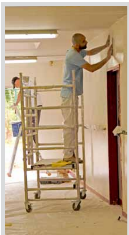
École du Buffle

sol au plafond ont été repeints, l'électricité remise en état, des cloisons abattues pour permettre de réaménager les espaces. Le faux plafond a été ôté et ne fait plus caisse de résonance, un problème majeur de cet espace. La salle y gagne en lumière. Les services de la ville ont repeint tout le couloir de La licorne. La Régie d'insertion a remis en couleur les plafonds et murs des couloirs, le bureau de la directrice, et une classe de l'école du Buffle. A Pégase, le couloir du centre, le bureau de la directrice et une classe ont été repeints. Les deux restaurants scolaires et l'office à Langevin-Perrin ont fait peau neuve avec l'agrandissement notamment de la pièce principale. L'énrobé de la cour de l'école Belle au bois dormant a été refait, le portail a changé de place, des espaces seront mis en herbe et plantés.