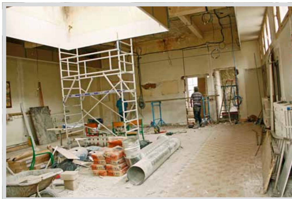
Réfectoire Gabriel Péri