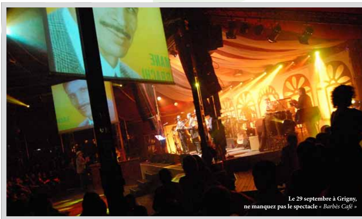
Le 29 septembre à Grigny, ne manquez pas le spectacle « Barbès Café »

« Le peuple français, au départ favorable à la colonisation de l'Algérie et à la guerre, à finalement basculé en faveur de son indépendance et de la paix ».