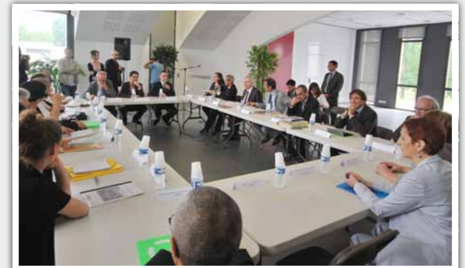
Des échanges avec les associations au Centre de la Vie Sociale

François Lamy, Ministre de la Ville s'est rendu à Grigny. Il a visité la copropriété de Grigny2 et la Grande Borne. Il a rencontré les acteurs locaux pour mieux comprendre les préoccupations des habitants des quartiers.